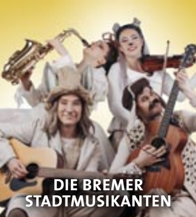
DIE BREMER STADTMUSIKANTEN