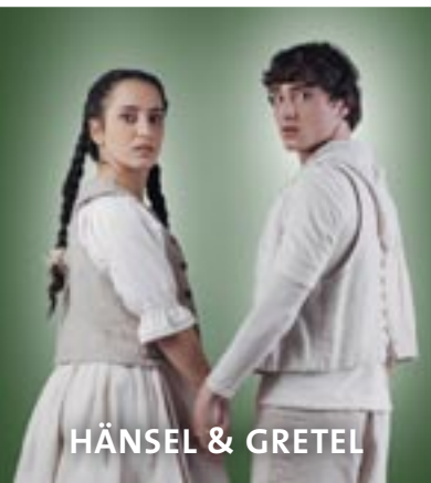
HÄNSEL & GRETEL