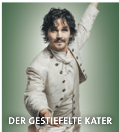
DER GESTIEFELTE KATER