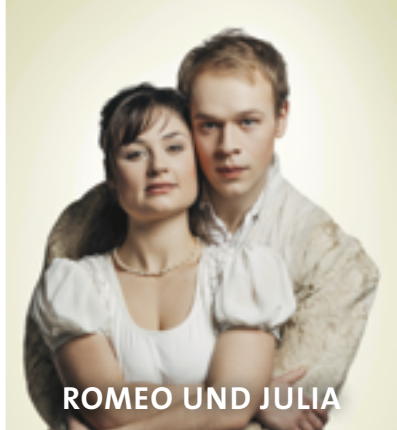
ROMEO UND JULIA